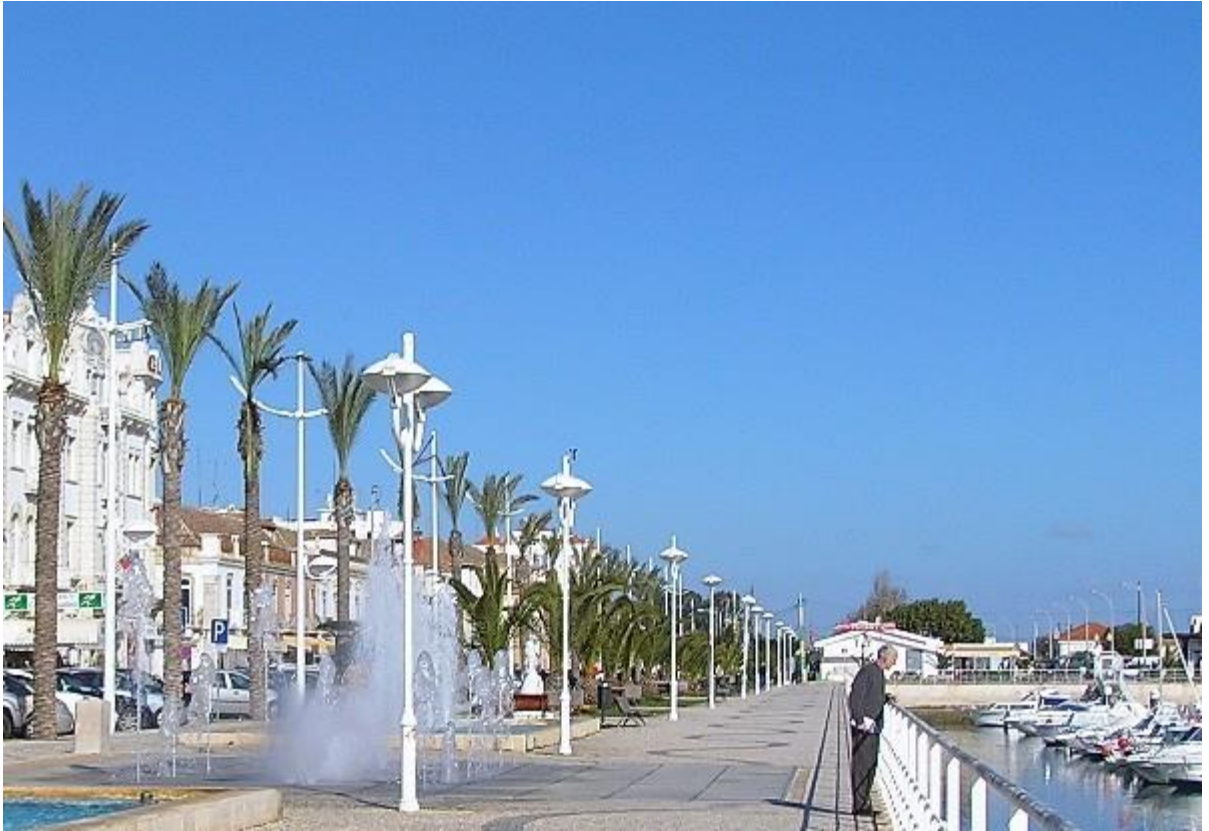
マリーナ沿いの遊歩道。言わば旧市街の顔の部分。右端の赤屋根がフェリー乗場。