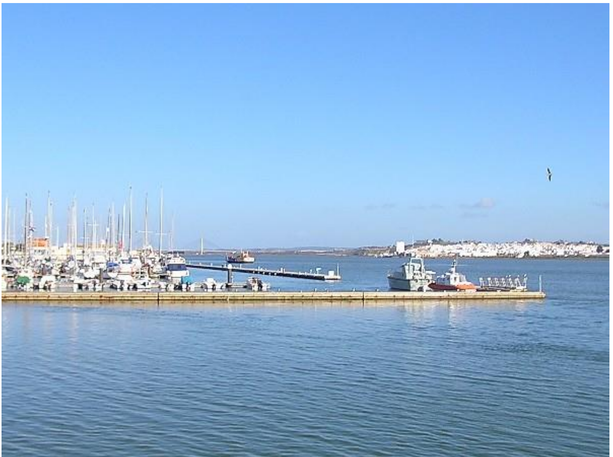
マリーナから上流を見る。右端がアヤモンテ。中央にフェリー、ずっと上流に橋脚。